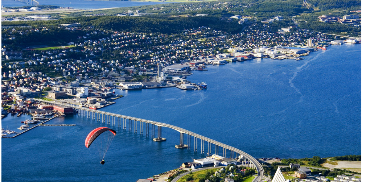
Nordens Paris: Rødt Tromsø gjør det godt på målingene.