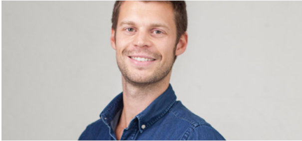
Støtter streiken: Bjørnar Moxnes.