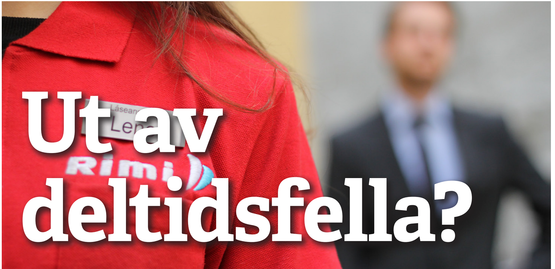
Deltidsfella: Kvinner deltidsarbeid er en av vår tids største likestillingsutfordring.